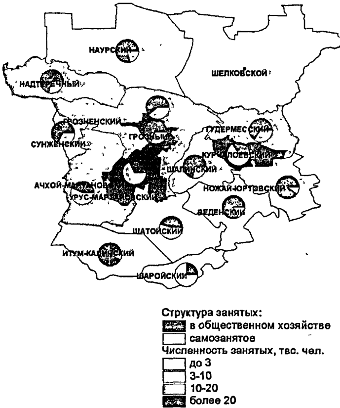
Рис.2. Территориальная дифференциация трудовых ресурсов Чеченской Республики и их распределения по сферам деятельности