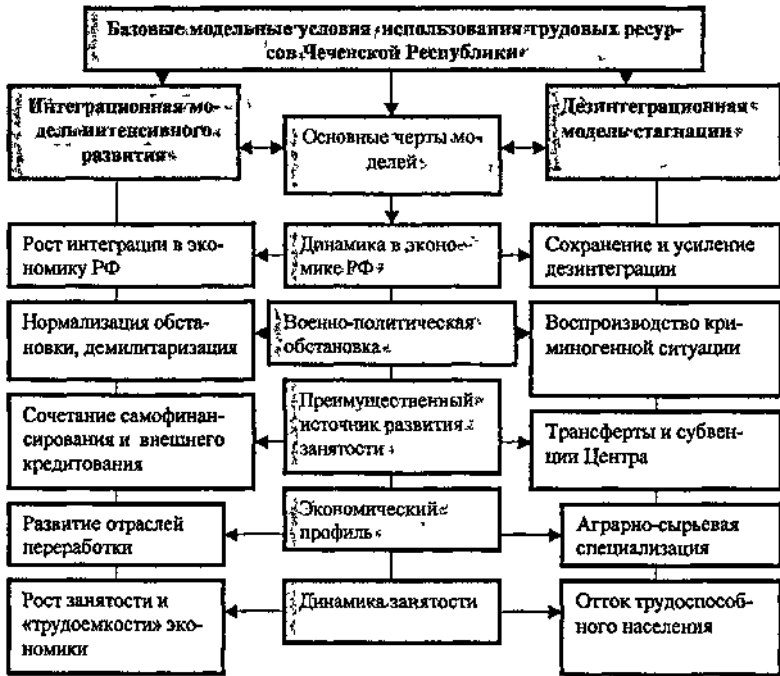
Рис. 4. Базовые модели использования трудовых ресурсов Чеченской Республики

шего потребности населения республики в рабочих местах и приемлемого уровня жизни.