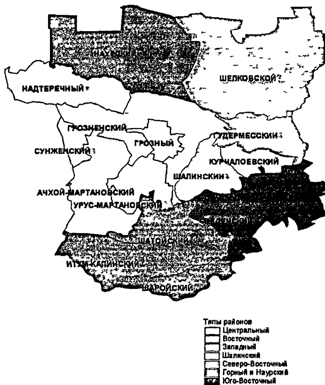
Рис.3. Дифференциация субрегионов Чеченской Республики по факторам и особенностям формирования и использования трудовых ресурсов.

2. Восточный - представлен Курчалоевским районом. Доля населения, сконцентрированного в крупных поселениях, почти максимальна (0,88),