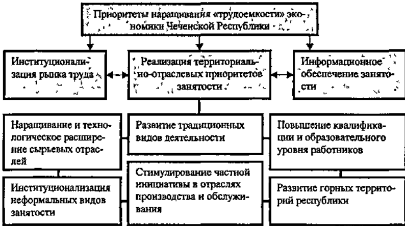
Рис. 5. Территориально-отраслевые приоритеты занятости в системе мер наращивания «трудоемкости» экономики Чеченской Республики

Соответствующие приоритеты могут быть обозначены и для выделенных ранее ареалов: Центральный - является традиционным центром как промышленного освоения, так и нефтедобычи, перспективна организация малого бизнеса сферы услуг, розничной торговли, мелкие вспомогательные производства, в перспективе - занятость на восстанавливаемых машиностроительных предприятиях и в строительстве; Восточный - сочетание трудовых маятниковых миграций, развития личных подсобных хозяйств, роста их товарности, динамики занятости в строительной отрасли, Западный - пригородное хозяйство и частичная занятость населения в г. Грозном; Шалинский - развитие строительной отрасли, Северо-восточный - расширение занятости в нефтедобыче, формирование вспомогательных производств, развитие сельского хозяйства по пригородному типу, виноградарских или же животноводческих предприятий овцеводческого типа, Горная зона и Наурский район - развитие товарного производства в личных подсобных хозяйствах скотоводческой специализации и организация первичной переработки продуктов животноводства, Юго-восточная зона - характеризуется оттоком трудовых ресурсов как в Грозный, так и более близкие развитые Шалинский,