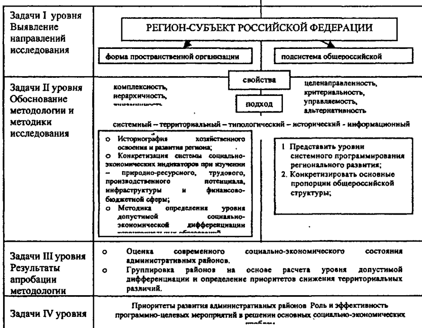
Рис. 1. Уровни и задачи исследования региона-субъекта РФ.

Методический подход к изучению региона основан на четырехуровневой системе анализа, где регион-субъект РФ выступает как подсистема общероссийской структуры народного хозяйства и как форма пространственной организации (рис. 1).