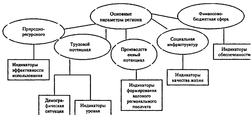
Рис. 2 Элементы исследования социально-экономического развития конкретной территории.

Характеристика основных элементов исследования социально-экономического развития территории Омской области показала, во-первых, низкую эффективность использования природно-ресурсного потенциала. Несмотря на внушительный перечень полезных ископаемых Омской области, они слабо изучены и не имеют особого значения для развития основных отраслей промышленности, за исключением земельных ресурсов, используемых в сельском хозяйстве.