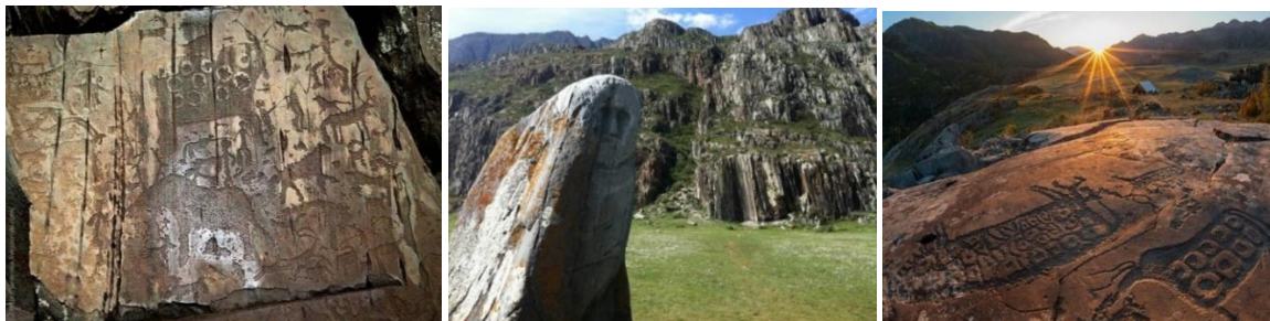
Рисунок 3 – Музеи под открытым небом, петроглифы урочища Калбак-Таш [5]

Судя по изображениям, Калбак-Таш был особенным местом для людей в разные эпохи (рисунок 3). Более того, здесь встречаются рисунки солнца, схема солнечной системы, карта неба, а значит, урочище могло быть обсерваторией. На территории комплекса, также были обнаружены огороженные площадки, созданные для обрядов или жертвоприношений.