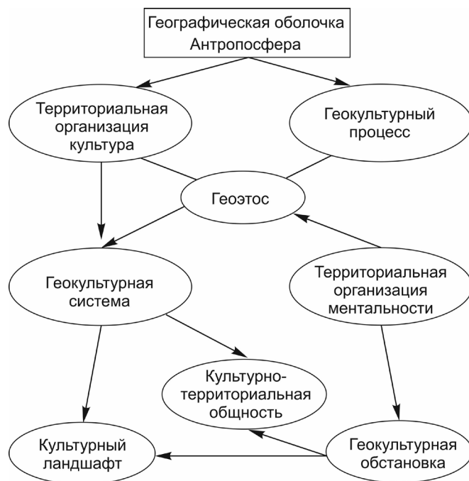
Рис. 1. Структурно-иерархическая соподчиненность основных понятий, использующихся в этологической географии, в предметно-объектном контексте географической науки.

Ментальность в географическом пространстве может быть выражена в географической оболочке только через антропосферу как наивысший таксономический ранг пространственной организации человечества. Геокультурная система, объединяющая под собой все обусловленные культурогенезом территориальные системы, интегрирует геоэтнос как одну из составляющих геокультурного процесса (процесса пространственного саморазвития различных культурно-территориальных образований). Геоэтнос выступает не как самостоятельный компонент геокультурной системы, а именно как функция отношения между компонентами, обусловленными культурогенезом.