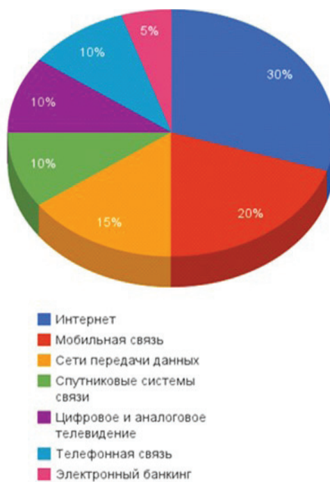
Рис. 2 / Fig. 2. Виды ИКТ услуг в Российской Федерации, 2019 г. / Types of ICT services in the Russian Federation, 2019

электронной и криптовалютной (биткойном, блокчейном и т. д.).