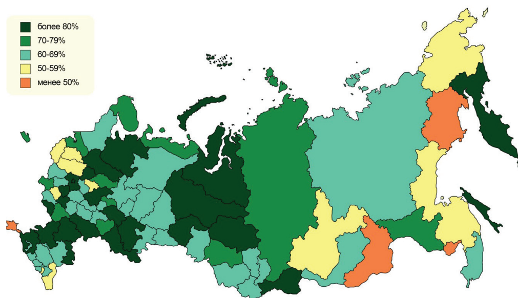
Рис. 3 / Fig. 3. Доля граждан, использующих механизм получения государственных и муниципальных услуг в электронной форме (% от общей численности населения) в 2019 г. / Share of citizens using the mechanism of obtaining state and municipal services in electronic form (% of the total population) in 2019

Источник: Информационное общество в Российской Федерации. 2020 : стат. сб. М.: НИУ ВШЭ, 2020. 328 с.