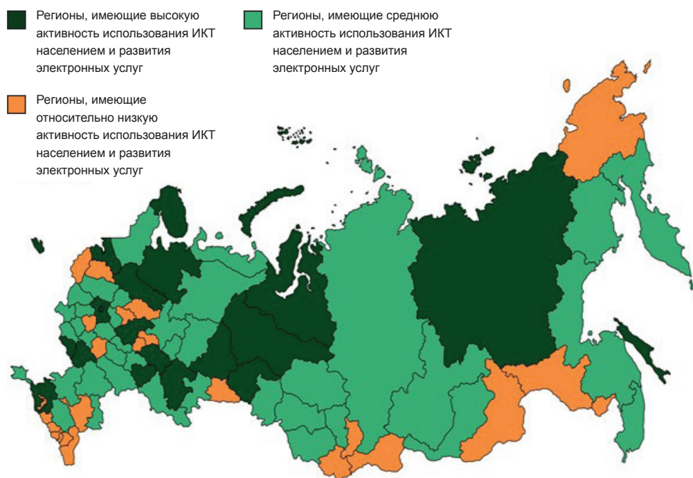
Рис. 4 / Fig. 4. Типология регионов Российской Федерации по активности использования ИКТ населением и развития электронных услуг / Typology of the regions of the Russian Federation according to the activity of the ICT use by the population and the development of electronic services

В результате проведённого исследования по активности информацион-